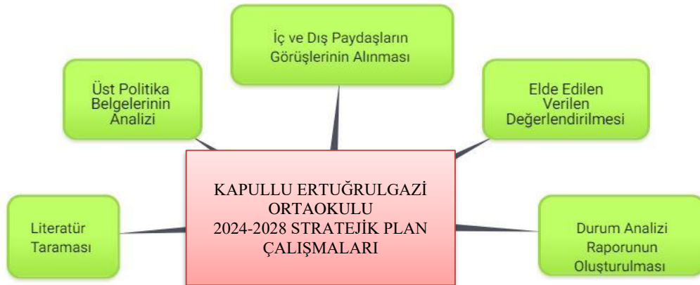
Stratejik Plan Hazırlık Süreci şeması

2024-2028 dönemi stratejik plan hazırlanması süreci Strateji Geliştirme Kurulu ve Stratejik Plan Ekibinin oluşturulması ile başlamıştır. Ekip tarafından oluşturulan çalışma takvimi kapsamında ilk aşamada durum analizi çalışmaları yapılmış ve durum analizi aşamasında paydaşlarımızın plan sürecine aktif katılımını sağlamak üzere paydaş anketi, toplantı ve görüşmeler yapılmıştır. Durum analizinin ardından geleceğe yönelim bölümüne geçilerek okulumuzun amaç, hedef, gösterge ve eylemleri belirlenmiştir.